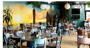
Pizzeria Pink Flamingo

Êtes vous prêts pour l'île ? Venez chez nous et vous vous sentirez en vacances. Nous vous emmènerons à la plage et à la "mer", chez nos flamants roses. Prenez un apéritif avec nos délicieux tapas et un cocktail autour d'un feu de camp dans notre bar tiki.