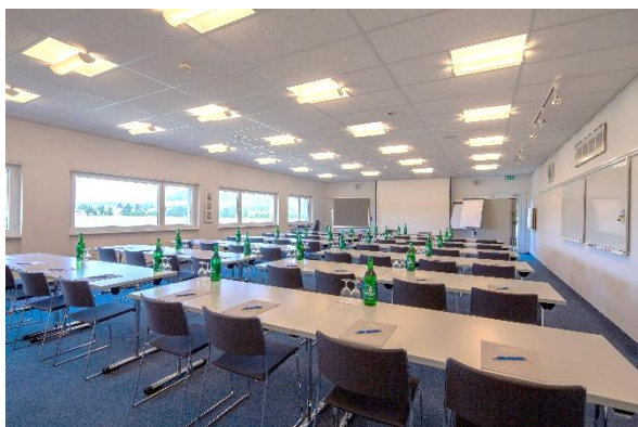
Salle de séminaire "Jura"

Notre équipe de cuisine prend volontiers en compte les allergies. Veuillez nous communiquer le nombre de végétariens/végétaliens et les éventuelles allergies au plus tard le jour de l'arrivée.