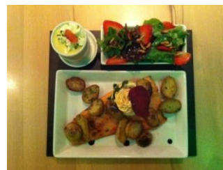
Déjeuner du capitaine

Pour gagner du temps, nous vous proposons le menu du jour sous forme de petit&raffiné ou le menu business sous forme de déjeuner du capitaine. Dans le cas de petit&raffiné/ déjeuner du capitaine, le menu complet vous est servi en une seule fois et vous pouvez savourer votre menu sans attendre longtemps. Au lieu d'un menu à deux plats, vous recevez un plat principal un peu plus petit, avec une petite salade et un mini-dessert.