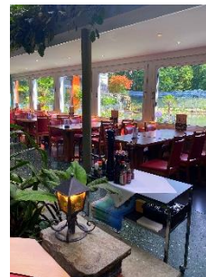
Restaurant plantes tropicales

Avec ses 450 places assises, l'espace séduit par sa diversité et son originalité. Que ce soit dans le Maroc aux accents orientaux, dans le restaurant tropical ou dans la confortable Seestube avec vue sur le lac de la forêt. Chaque espace dégage une atmosphère particulière grâce à son caractère propre. Pour les amateurs de soleil, le jardin d'hiver recouvert de verre ou la terrasse offrent l'ambiance adéquate.