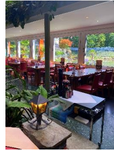
Restaurant plantes tropicales

Avec ses 450 places assises, l'espace séduit par sa diversité et son originalité. Que ce soit dans le Maroc aux accents orientaux, dans le restaurant tropical ou dans la confortable Seestube avec vue sur le lac de la forêt. Chaque espace dégage une atmosphère particulière grâce à son caractère propre. Pour les amateurs de soleil, le jardin d'hiver recouvert de verre ou la terrasse offrent l'ambiance adéquate.