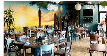
Pizzeria Pink Flamingo

Êtes vous prêts pour l'île ? Venez chez nous et vous vous sentirez en vacances. Nous vous emmènerons à la plage et à la "mer", chez nos flamants roses. Prenez un apéritif avec nos délicieux tapas et un cocktail autour d'un feu de camp dans notre bar tiki.